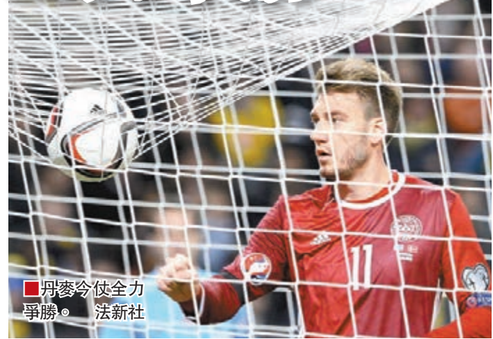
丹麥今仗全力爭勝。

明晨歐國盃外圍賽附加賽次回合展開生死決，丹麥將主場迎戰瑞典；由於首回合客落敗1:2，丹麥今仗已無退路全力爭勝，而瑞典則力爭保住優勢晉級。(有線61及201台周三3:45a.m.直播)