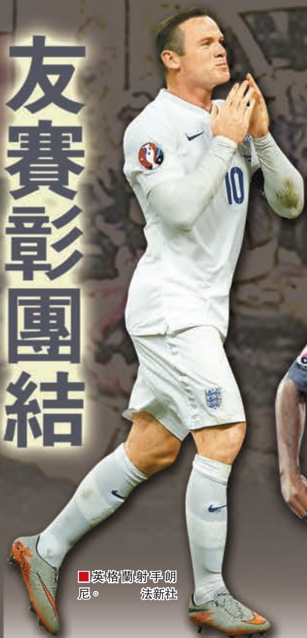
英格蘭射手朗尼。

英格蘭(三獅)與法國(高盧雄雞)的足球較勁已有92年，雙方一直互不相讓，但明晨假溫布萊球場進行的英法之戰，則在巴黎恐襲慘劇的影響下變成沒有激鬥，只有團結一致的目標，藉體育運動宣揚和平友愛。其中至親不幸喪生的法國防中狄亞拉，更忍著悲傷隨隊出征，身體力行向暴力行為說「不」。(周三4:00a.m.開賽)