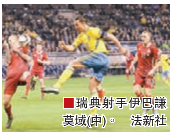
瑞典射手伊巴謙莫域(中)。

明晨歐國盃外圍賽附加賽次回合展開生死決，丹麥將主場迎戰瑞典；由於首回合客落敗1:2，丹麥今仗已無退路全力爭勝，而瑞典則力爭保住優勢晉級。(有線61及201台周三3:45a.m.直播)