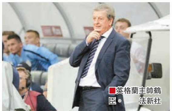
英格蘭主帥鶴臣。

「三獅」領隊鶴臣直言今仗意義大於賽果：「比賽將會相當嚴肅，但它展示出足球世界是會團結一致地