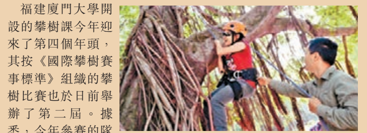
■廈門大學開設攀樹課今年踏進第四年。

福建廈門大學開設的攀樹課今年迎來了第四個年頭，其按《國際攀樹賽事標準》組織的攀樹比賽也於日前舉辦了第二屆。據悉，今年參賽的隊員中，女生人數首次超過男生，而且這一校級賽事亦創出好成績，一位女生26秒2的好成绩甚至超過去年香港國際攀樹錦標賽的最好成績。校方表示，比賽按照國際標準執行，成績優秀者將參加香港國際攀樹賽。