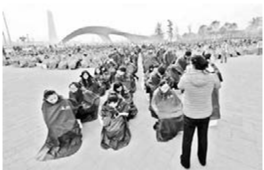
■主辦單位在霧霾天組織大批市民參加拼「肺」活動惹爭議。網上圖片

我出不門就不出門了，為了該活動我一大早就起來，你說這活動是號召大家重視肺健康的，可是我們頂着霧霾在這兒站了好幾個小時，這不就是对肺不好嗎？」