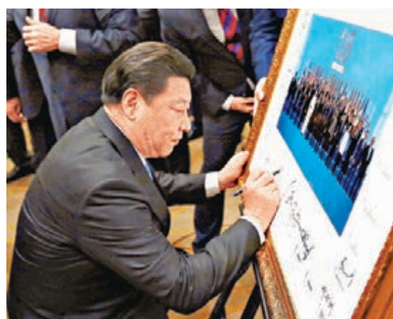
■習近平在領導人合影上簽名。