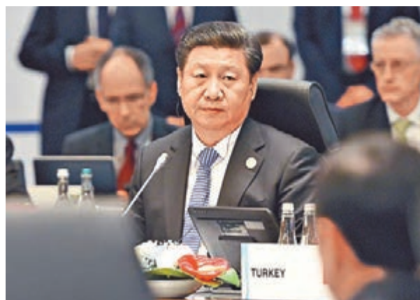
■習近平出席G20峰會。

香港文匯報訊 據新華網報道，二十國集團領導人第十次峰會11月15日在土耳其安塔利亞舉行。中國國家主席習近平出席並發表題為《創新增長路徑 共享發展成果》的重要講話，強調中國有信心、有能力保持經濟中高速增长。