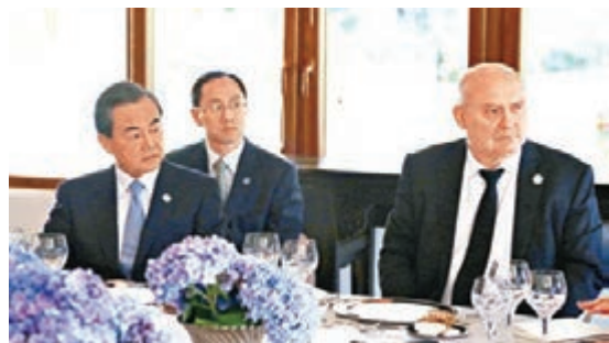
■王毅(左)表示，國際社會應形成反恐統一戰線。 新華社