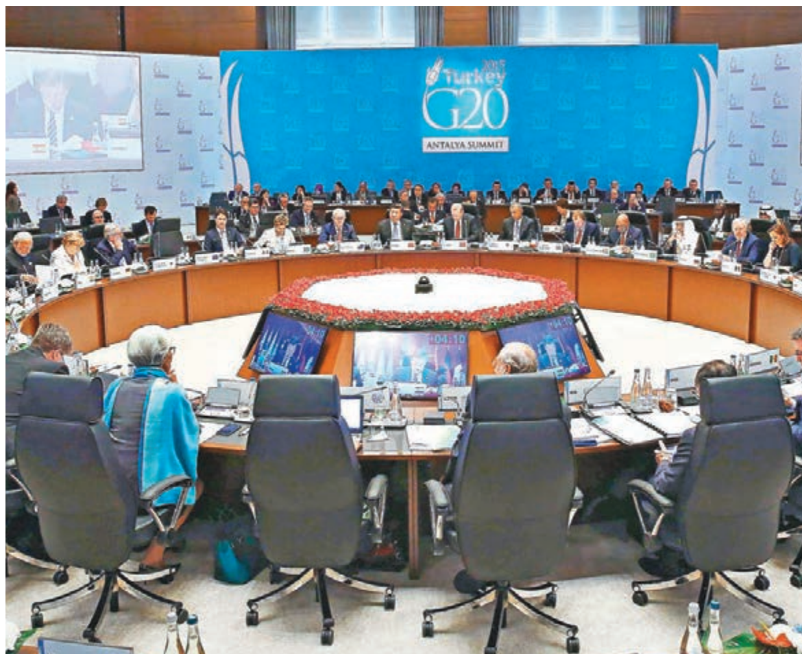
■土耳其安塔利亞二十國集團領導人峰會會議現場。

習近平提出以下幾點建議。第一，加強宏觀經濟政策溝通和協調，形成政策和行動合力。第二，推動改革創新，增強世界經濟中長期增長潛力。第三，構建開放型世界經濟，激發國際貿易和投資活力。第四，落實2030年可持續發展議程，為公平包容發展注入強勁動力。