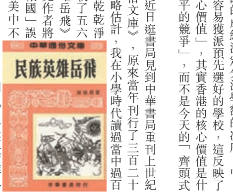
《民族英雄岳飛》。

年濃縮為幾冊書，讀者當然可以放「馬後炮」，知道郭靖的天賦專長不在讀書認字。今時今日香港年輕家長最大的煩惱，恐怕是有不少人妄想把郭靖般的孩子培養出黃蓉的成績。郭靖多操練沒問題，關鍵在於有沒有明師為他設計學習方案。升中試的人，正是苦著今天小孩及其家長的元兇首惡！我們那個年代大略按升中試的成績決定分派學額的次序，中英、數三科成績好的學生容易獲派預先選好的學校，這反映了現實社會優勝劣敗的「核心價值」，其實香港的核心價值是什麼？我認為是「相對公平的競爭」，而不是今天的「齊頭式平等」。