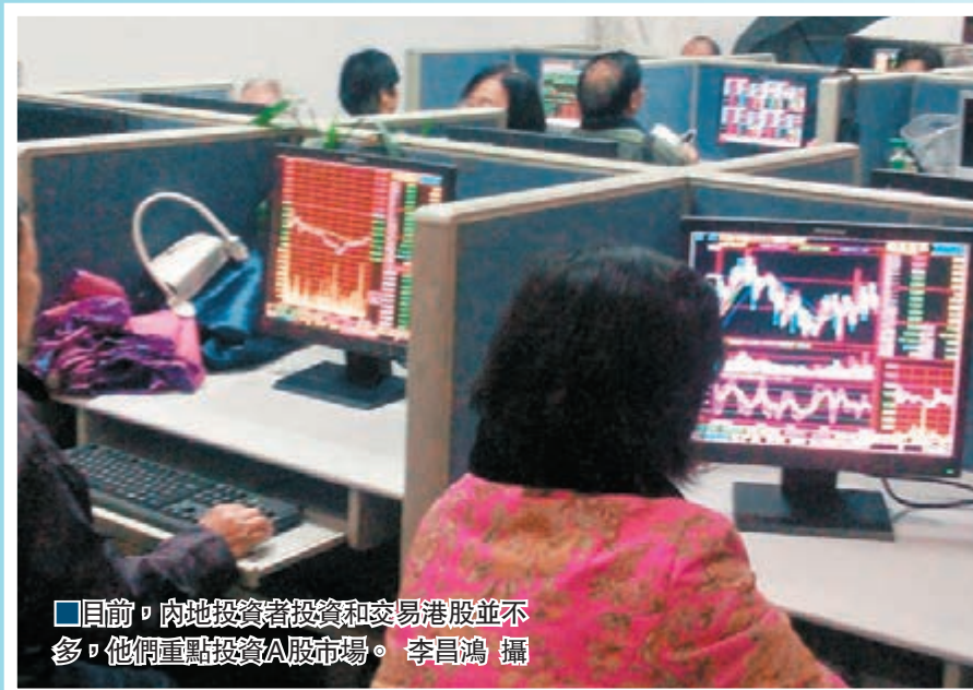
■目前，內地投資者投資和交易港股並不多，他們重點投資A股市場。