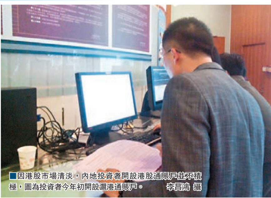
■因港股市場清淡，內地投資者開設滬股通賬戶並不多，圖為投資者今年初開設滬股通賬戶。