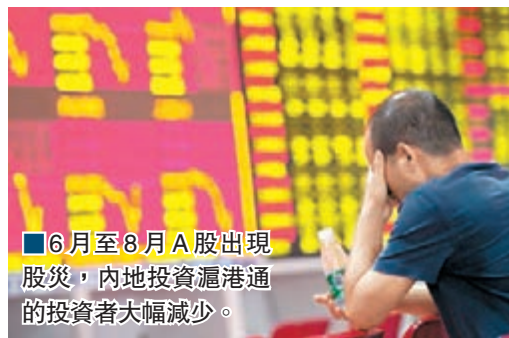
■6月至8月A股出現股災，內地投資滬港通的投資者大幅減少。

香港文匯報訊(記者 李昌鴻 深圳報道)與上海的情況相若，深圳股民對滬港通也是觀望味濃。由於自6月至8月A股股災連累港股持續暴跌，內地投資滬港通的投資者大幅減少，記者從深圳一些券商了解到，目前每天很少看