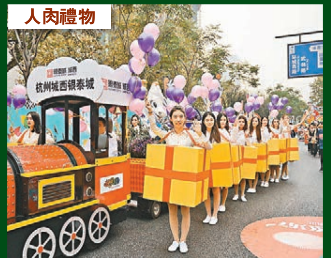
浙江杭州延安路鳳起路人潮湧動，杭州大巡遊昨日正式拉開帷幕。本次大巡遊的路線長1.1公里，是該市某集團17周年「中國購物節」主題活動的重頭戲之一。

為期兩天的「絲綢之路出土民族契約文書研究」國際學術論壇會邀請了國內外60餘名專家，專家帶來了30餘場報告，展示了41件珍貴文書。內容主要涉及古絲綢之路上的土地、住宅、水井、果園、樹木等買賣文書，以及古代居民的財產贈送、轉讓、遺產的分配等文書。與會專家通過這些文書留下的記憶碎片，向人們再現了古絲綢之路上的一个个神祕的故事。