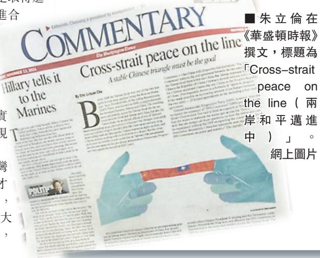
朱立倫在《華盛頓時報》撰文，標題為「Cross-strait peace on the line (兩岸和平邁進中)」。

香港文匯報訊 據中通社報道，朱立倫結束美國華府行，白宮國安會亞太事務資深主任康達在當地時間13日表示，與朱立倫的對話很有成效 (productive)，接待規格也與蔡英文相同，美國對於台灣的選舉不選邊站，也期待與台灣民眾選出的下任領導人合作。