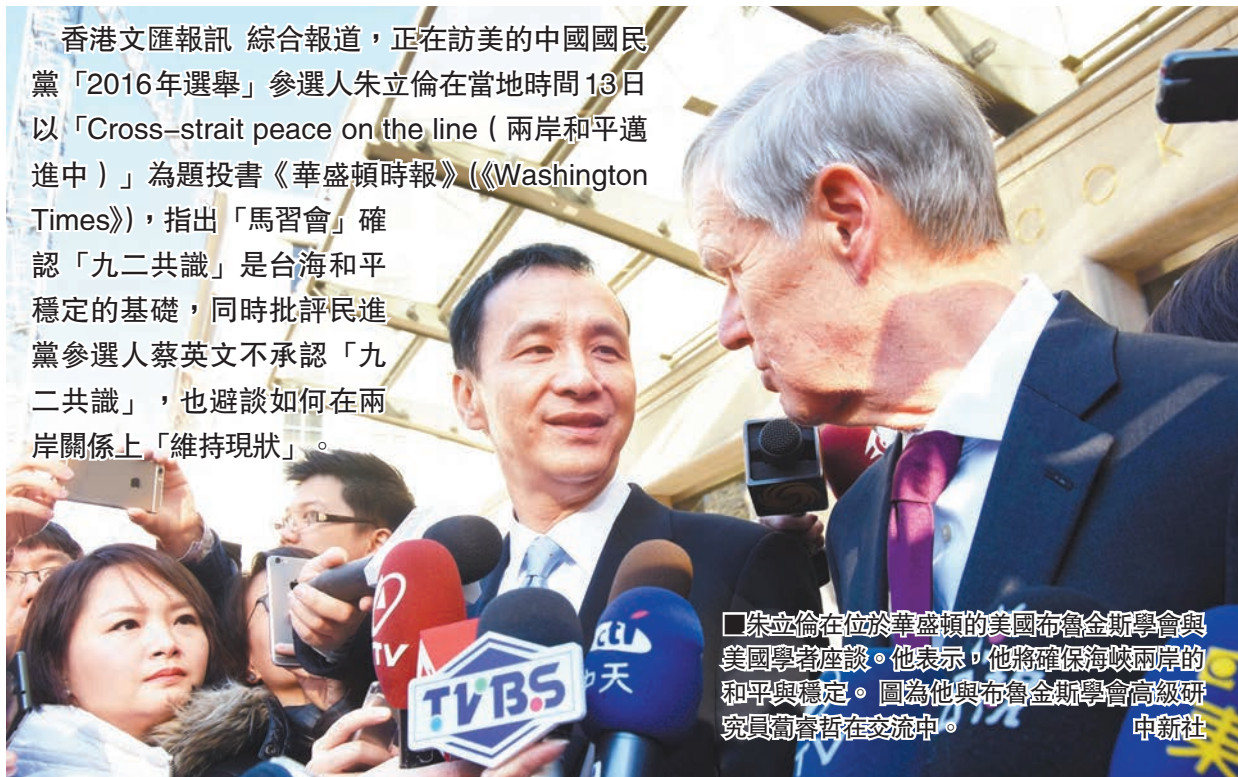
朱立倫在位於華盛頓的美國布魯金斯學會與美國學者座談。他表示，他將確保海峽兩岸的和平與穩定。圖為他與布魯金斯學會高級研究員喬希在交流中。

香港文匯報訊 綜合報道，正在訪美的中國國民黨「2016年選舉」參選人朱立倫在當地時間13日以「Cross-strait peace on the line (兩岸和平邁進中)」為題投書《華盛頓時報》(《Washington Times》)，指出「馬習會」確認「九二共識」是台海和平穩定的基礎，同時批評民進黨參選人蔡英文不承認「九二共識」，也避談如何在兩岸關係上「維持現狀」。