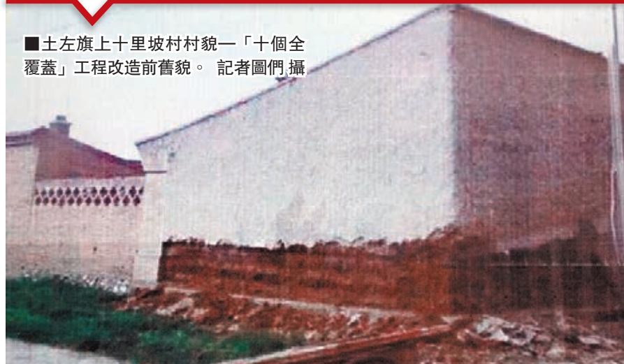
■土左旗上十里坡村村貌—「十個全覆蓋」工程改造前舊貌。