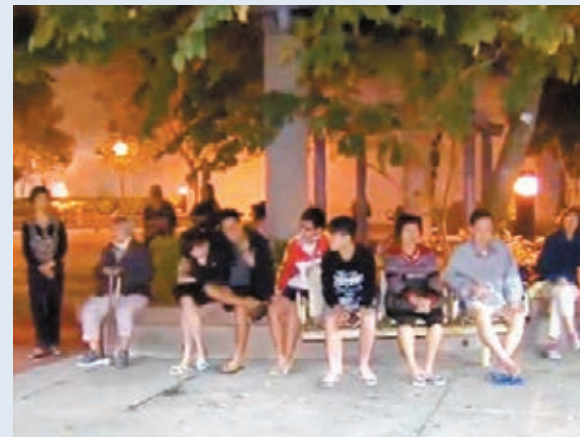
白田邨一個高層單位冒煙起火，約60名居民一度疏散。無線電視圖片

香港文匯報訊（記者杜法祖）深水埗白田邨盛田樓發生懷疑縱火案，一個高層單位昨凌晨突然冒煙起火，街坊發現報警，消防員到場花約半小時將火救熄，其間約60名居民一度疏散，起火單位男住戶表示不適須送院。