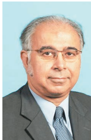
夏迪星宣佈即時辭去嶺大協理副校長及總務長職務。資料圖片