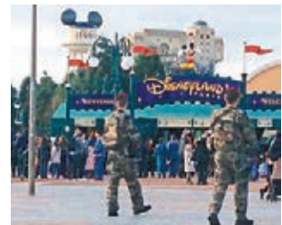
■巴黎迪士尼樂園罕有地休園一天。

巴黎市政府稱，市內的學校、市集、博物館、圖書館等公共設施及主要旅遊區昨日關閉，當局會加強市政廳的保安。由於未能安排保安人員，巴黎及周邊地區一律禁止舉行公眾示威直至周四。每日有多達2萬遊客到訪的巴黎鐵塔，營運機構昨宣佈無限期關閉，直至另行通知。巴黎迪士尼樂園昨日亦罕有地宣佈閉園一日，