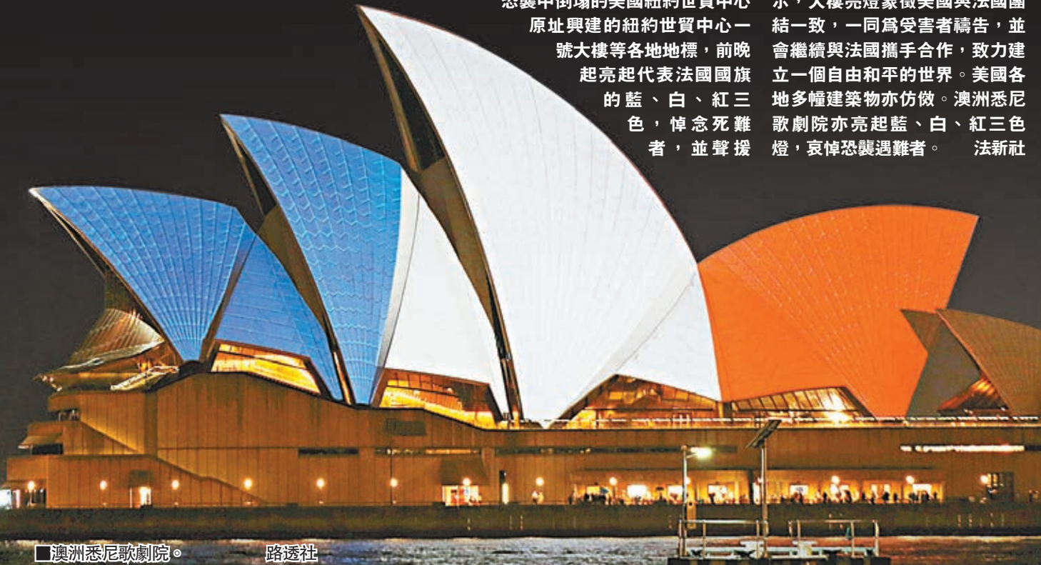
■澳洲悉尼歌劇院。