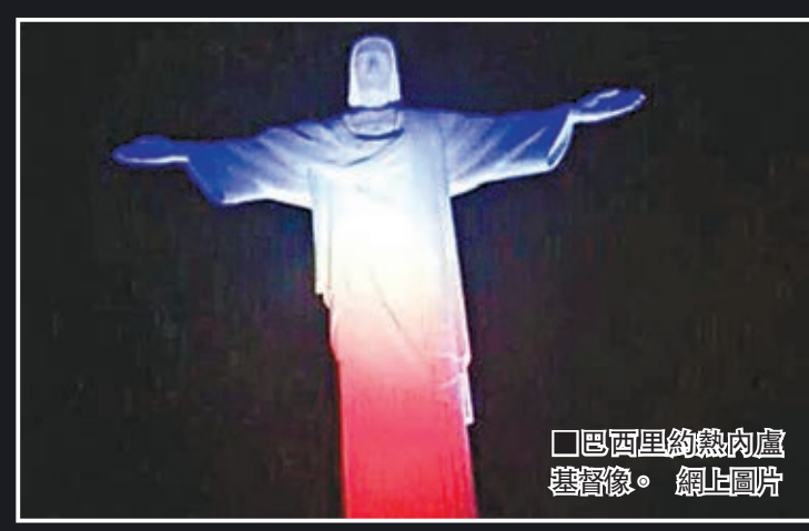
■巴西里約熱內盧基督像。網上圖片