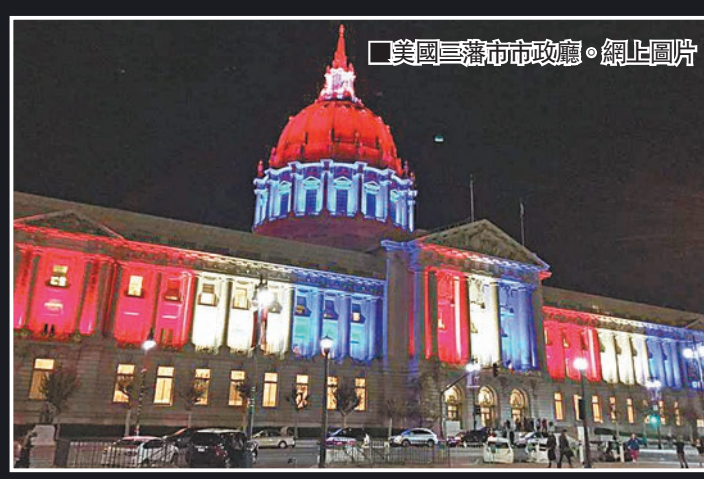
■美國三藩市市政廳。網上圖片