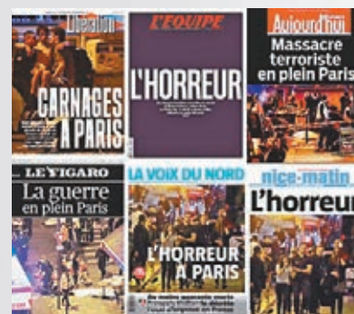
■法國報章頭版報道巴黎恐襲。網上圖片