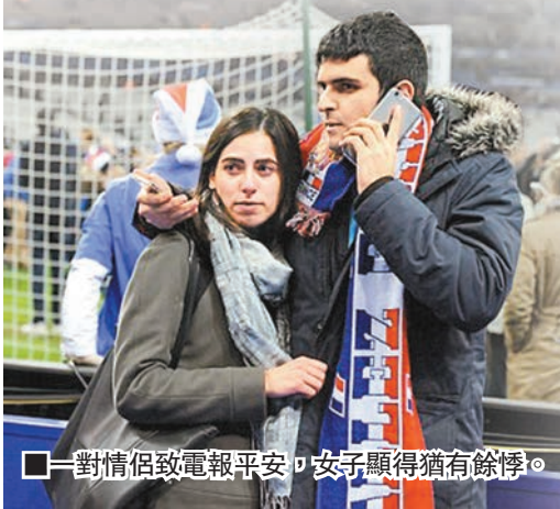
■一對情侶致電報平安，女子顯得猶有餘悸。