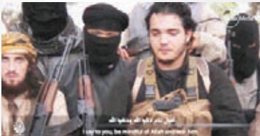
■「伊斯蘭國」在網上發片承認施襲。提高戒備，加強機場和火車站的保安。

今次多名恐怖分子同時於市內不同地區發動恐襲，反映計劃周詳，行事極具組織，有專家認為，襲擊手法與2008年印度孟買連環恐襲相似，形容兩次襲擊同樣針對多個人流聚集的「軟目標」，亦同樣有武裝分子持槍闖入建築物挾持人質。有孟買民眾得悉巴黎受襲後表示憤怒，形容事件勾起他們7年前的可怕回憶。印度首都新德里和孟買已