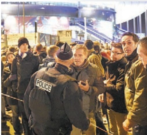
■場外球迷一臉茫然，找警察協助。