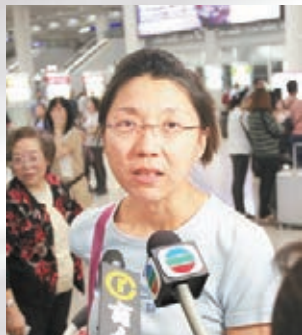
■移民法國廿多年的港人陳小姐不擔心當地會變得危險，認為恐怖分子襲擊巴黎後不會再在同一地點落手。

另外，一批香港市民及在港法國人昨晚自發在中山紀念公園舉行悼念會，法國駐港總領事亦有出席。