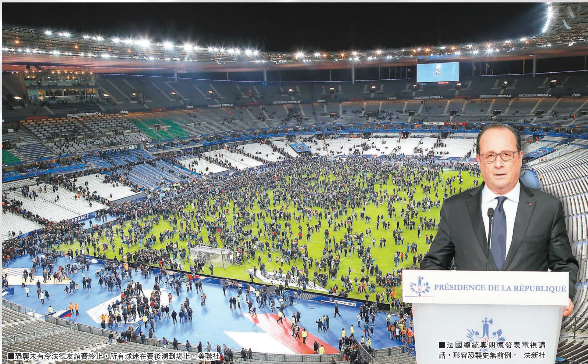
■恐襲未有令法德友誼賽終止，所有球迷在賽後湧到場上。