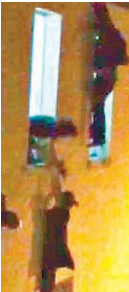
■一名女子吊在2樓窗外，令人想起「911」恐襲。