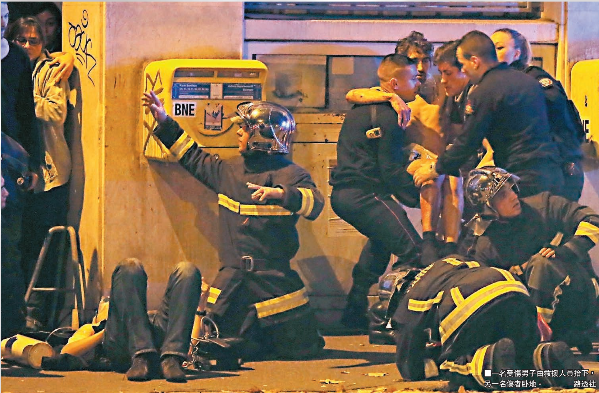
■一名受傷男子由救援人員抬下，另一名傷者臥地。