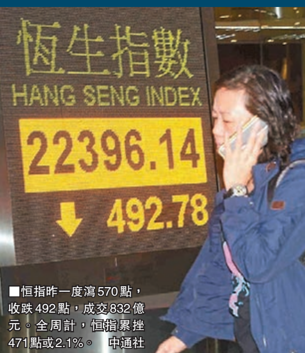
■恒指昨一度瀉570點,收跌492點,成交832億元。全周計,恒指累挫471點或2.1%。 中通社