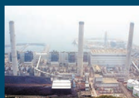
■長建將取代電能成為藍籌。