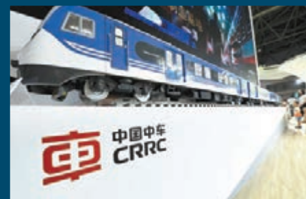
■中車將晉身國指成分股。