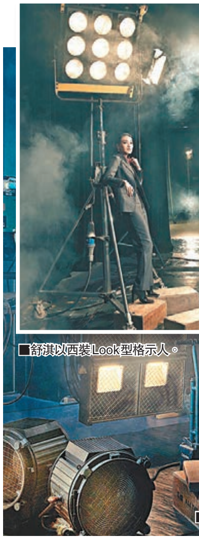
舒淇以西裝Look型格示人。

香港文匯報訊 第52屆金馬獎頒獎典禮將在本月21日於台北市國父紀念館舉行。金馬執委會第三度與首席襄贊「伯爵」合作拍攝「金馬52榮耀時刻」系列照片，為入圍金馬獎最佳導演的侯孝賢、萬瑪才旦、賈樟柯、徐克，入圍男主角的郭富城、馮小剛、鄧超、李鴻其、董子健，入圍女主角的張艾嘉、舒淇、林嘉欣、趙濤、宋芸樺留下雋永畫面，記錄華語影壇精彩動人的瞬間。有別於以往的拍攝模式，今年主題為「電影片廠」，聚集兩岸三地的明星大導回到最熟悉的場域，在水銀燈、軌道、器材箱、導演椅之間，展現對電影工作的熱愛與執著，同時讓觀眾一覽鏡頭外的故事，分享幕後的歡笑與汗水。此次拍攝由著名造型師羅之遠為入圍者設計形象，並由香港知名Secret 9製作公司的著名攝影師CK帶領團隊負責拍攝，工程浩大，連日橫跨台北、香港和北京三地。