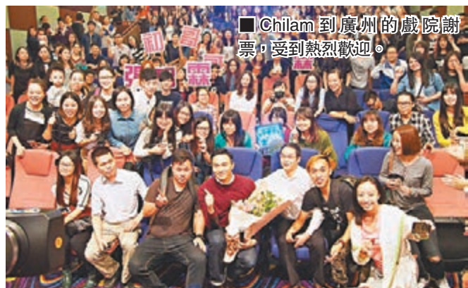
Chilam到廣州的戲院謝票，受到熱烈歡迎。

至於Chilam亦在光棍節專程去廣州的六間戲院，為點映場謝票，所有戲院全部滿座，粉絲一見Chilam就瘋狂大叫「你好靚仔」及「初哥哥」，又送花及大麥，寓意大收，Chilam更與粉絲自拍，令現場觀眾甚high。