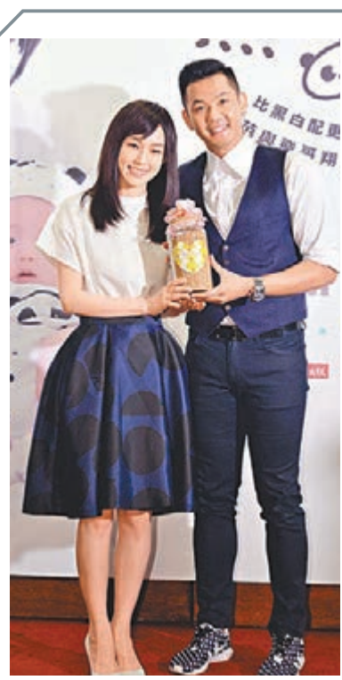
黑人為范范抱不平。

小女孩沒有難度，非常稱職。」她亦稱，自己非常喜歡經典小王子的故事，所以第一時間答應電影公司的邀請，參與這部動畫的配音工作。