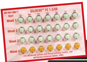
藥廠的避孕藥包裝順序出錯，導致多名婦女懷孕。圖為正確排列的避孕藥。

受害者入稟費城一間法院指控Qualitest。法庭文件指，原告人均按說明書服用口服避孕藥，但卻未起作用。由於包裝順序錯誤，使應按女性周期服用的藥丸排列方向「顛倒180度」，意味在容易懷孕的排卵期，服下沒避孕作用的安慰糖丸，在月經期反而吃下避孕藥。