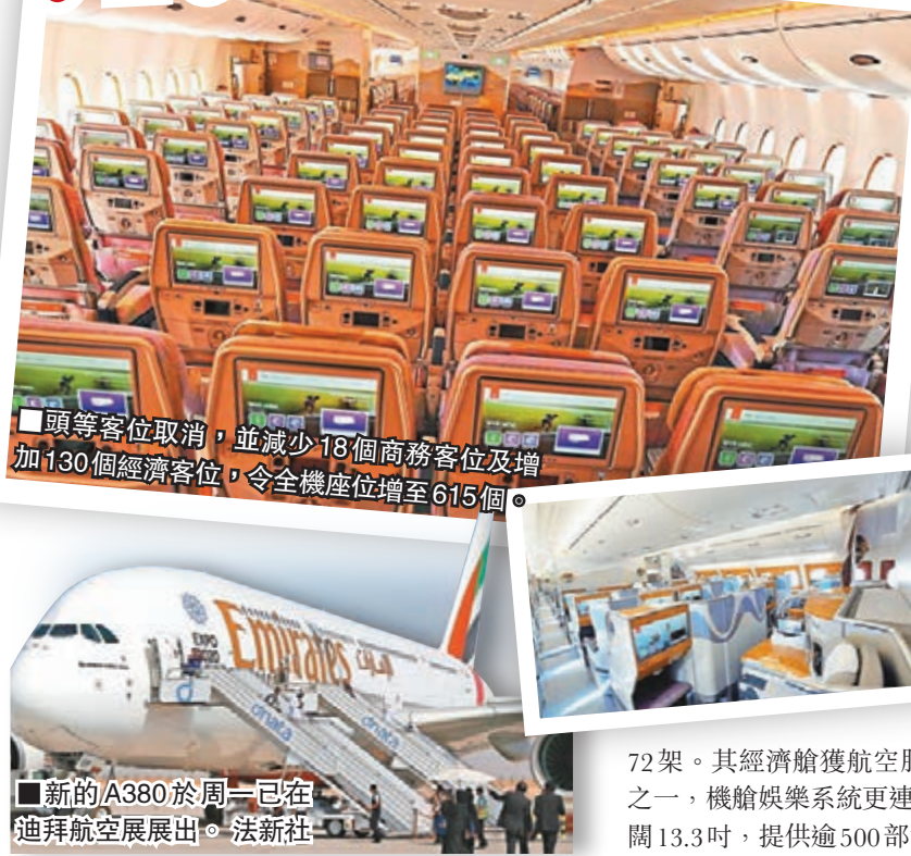
新的A380於週一已在迪拜航空展展出。

阿聯酋航空公司近日在迪拜航空展上，展示新設計的空中巴士A380客機，為增加載客量，公司取消頭等客位及減少18個商務客位，同時增加130個經濟客位，令全機客位增至615個，冠絕全球。不過乘客不用擔心因增加載客而令座位變小，前後座位之間仍維持32至34吋空間，僅座位闊度略為收窄0.5吋。