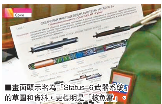
■畫面顯示名為「Status-6武器系統」的草圖和資料，更標明是「核魚雷」。

俄羅斯國營媒體國家電視台(NTV)及Channel One周二播出總統普京與軍方會面的片段，其中一段歷時數秒的畫面，顯示一份名為「Status-6武器系統」的草圖和資料，更標明是「核魚雷」。普京發言人佩斯科夫承認不慎洩漏機密，日後會採取預