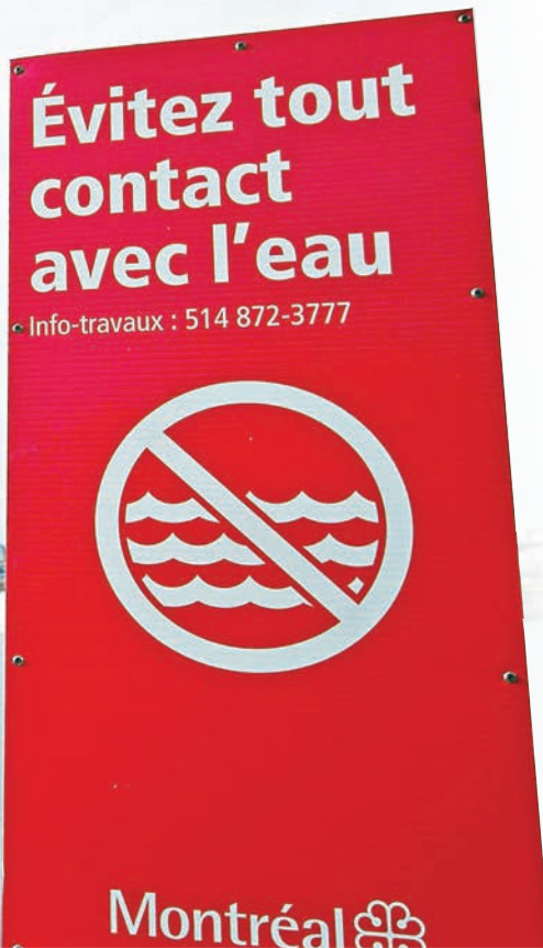
■市政府在聖勞倫斯河沿岸豎立標語，呼籲市民不要接觸河水。