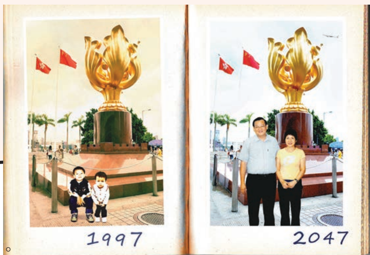
■「發現《基本法》」展覽學生作品。網上圖片

由於通識教育科已有詳細的課程規劃及評估指引，當中的教學內容往往與時事緊扣，而單元二「今日香港」中的「生活素質」和「法治和社會政治參與」有不少議題和概念都可涉及香港基本法，有關建議詳見表一。