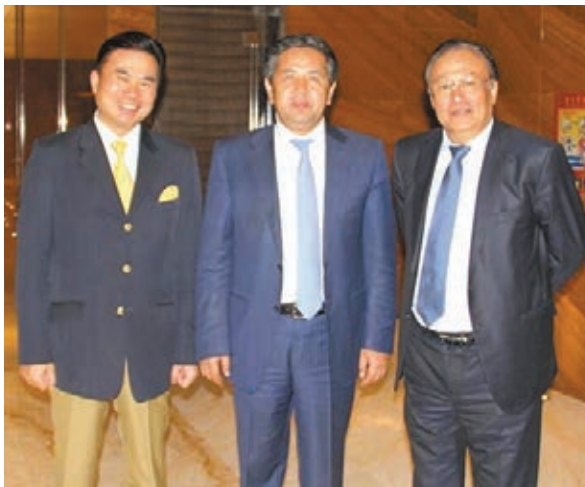
■鄔啟明（左）與吉爾吉斯斯坦第一副總理薩爾帕舍夫（中）、新疆自治區主席雪克來提·扎克爾（右）合影。

一分耕耘一分收穫。進入2015年，環球酒店頻現「一房難求」的火爆業績，同時，與烏魯木齊市內同為五星級酒店的某些國際品牌相比，環球酒店在入住率、營業額、餐飲口碑等多項指標上遙遙領先。自治區和烏魯木齊市的重大外事接待活動，如新疆自治區主席與吉