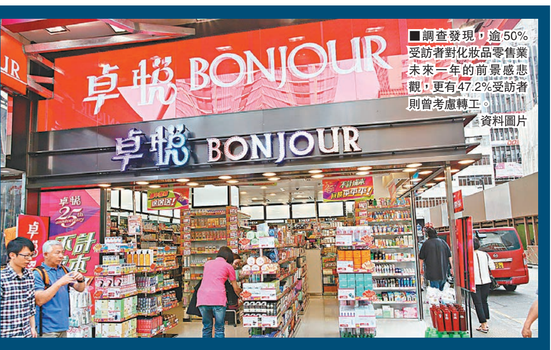
調查發現，逾50%受訪者對化粧品零售業未來一年的前景感悲觀，更有47.2%受訪者則曾考慮轉工。