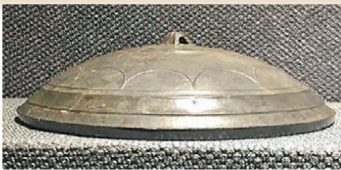
徐也力藏陽燧鏡A面