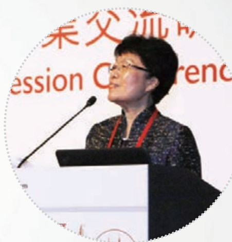
中國註冊會計師協會會長馮淑萍在2015年海峽兩岸及港澳地區會計師行業交流研討會上致辭