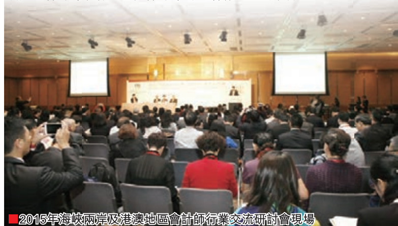
2015年海峽兩岸及港澳地區會計師行業交流研討會現場