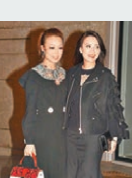
■祖兒與Mani向一對新人送祝福。