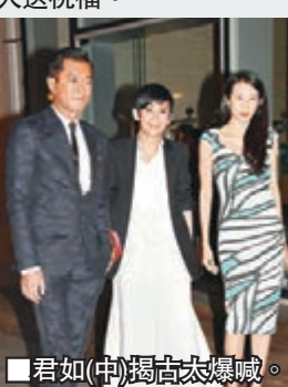
■君如(中)揭古太爆眼。