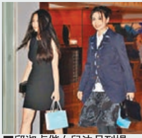
■邱淑貞偕女兒沈月到場。