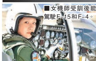
女機師受訓後能駕駛F-15和F-4。

日本防衛省昨日表示，為了響應首相安倍晉三提升女性地位的方針，計劃首次起用女自衛隊員擔任戰機機師，並會在本周內作出正式決定。報道指自衛隊已展開招募工作，預計經過3年訓練後，女飛行員能擔任F-15和F-4戰機的機師。