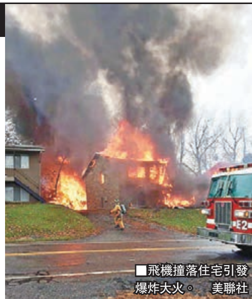
飛機撞落住宅引發爆炸大火。

失事飛機為10座位的霍克H25，當時正飛往阿克倫國際機場，在距機場3.2公里處墜毀。被撞住宅燒剩一面牆，旁邊一座住宅受波及起火，附近地區停電。飛機爆炸聲相隔幾個街口也能聽見，有居民也感受到震動。