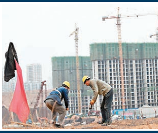
昨日，國家統計局發佈數據，2015年1月至10月，中國房地產開發投資同比名義增長2.0%，增速比1月至9月回落0.6個百分點。圖為山西太原民工在一建築工地作業。