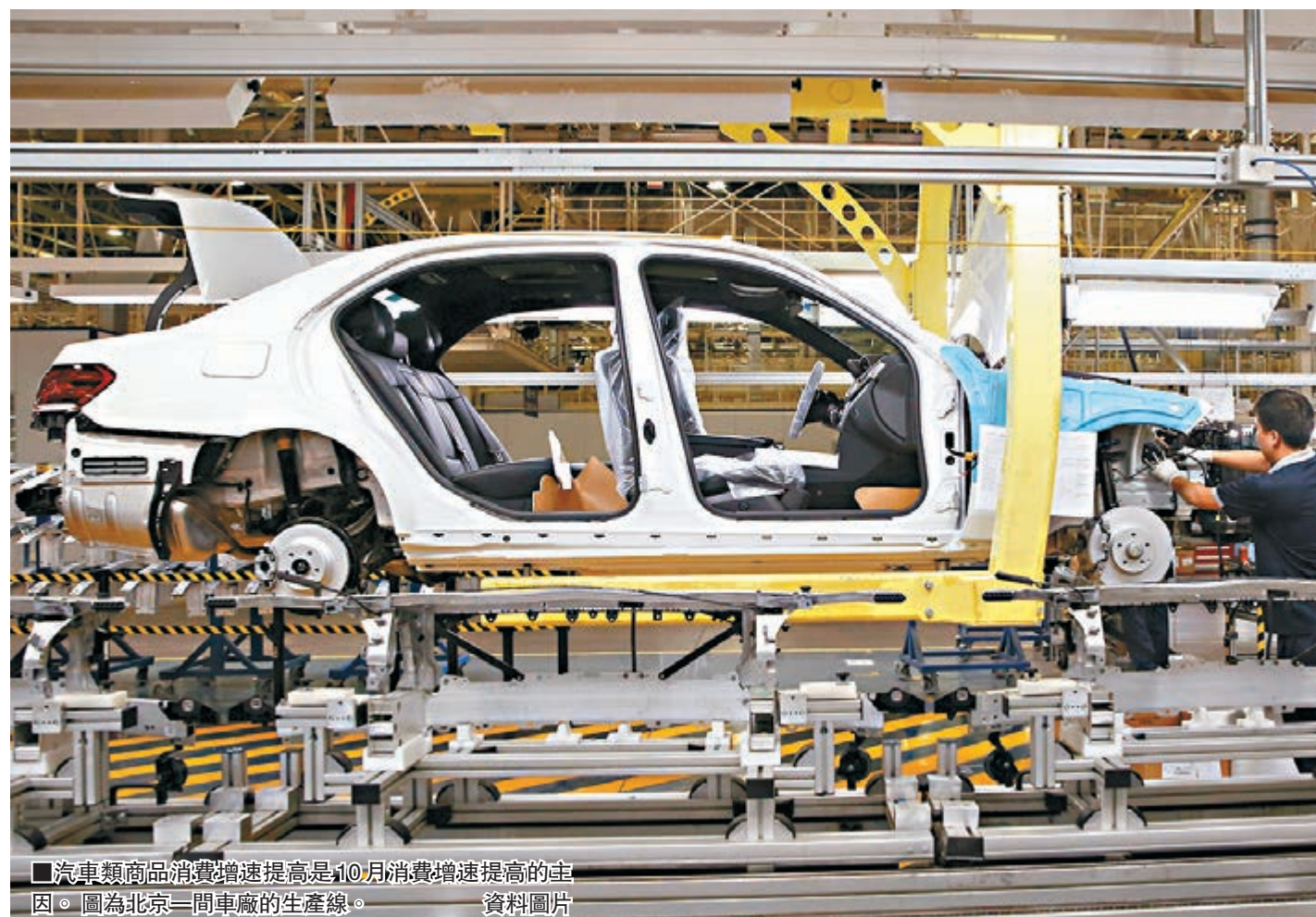
汽車類商品消費增速提高是10月消費增速提高的主因。圖為北京一間車廠的生產線。資料圖片