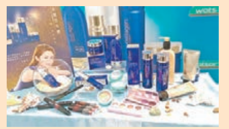
■Collagen by Watsons 系列