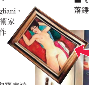
■《側臥的裸女》最終以1.74億美元落錘成交，約合港幣13.49億元。

當地時間11月9日晚，紐約佳士得「畫家與繆斯晚間特拍」在洛克菲勒中心舉槌，莫迪里阿尼作品《側臥的裸女》(1917-1918)最終以1.74億美元落錘成交，約合港幣13.49億元，創造了其作品拍賣新紀錄。據雅昌藝術網證實，買家為上海藏家劉益謙。 目前拍賣場上成交的最昂貴作品是今年5月11日以1.79億美元拍下的畢加索的《阿爾及爾的女人(O版)》(1955)，而莫迪里阿尼《側臥的裸女》則是第二貴的作品。兩幅均為女性裸體肖像畫。 亞美迪歐·莫迪里阿尼(Amedeo Modigliani, 1884-1920)是20世紀表現主義畫派的藝術家之一。1917年，他在巴黎展出裸女系列作品，在當時保守的社會吸引大批人在櫥窗外聚集，後警察下令結束展覽。