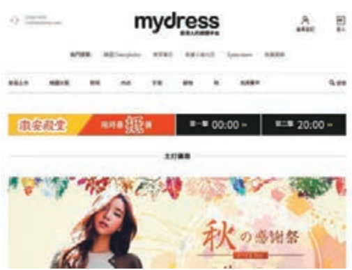
■南早早前宣佈以近 4,000 萬元代價收購網上時裝零售平台 MyDress。網上圖片

6,843 元。南早當時於公告指, 此舉「將提升集團網上佈局, 有助集團於具吸引力的香港電子商務市場站穩腳步」。另外, 交易將與集團的《領先》雜誌刊物互補, 通過收購帶來的協同效應致使其優質內容進一步商業化及現有讀者群進一步擴大。