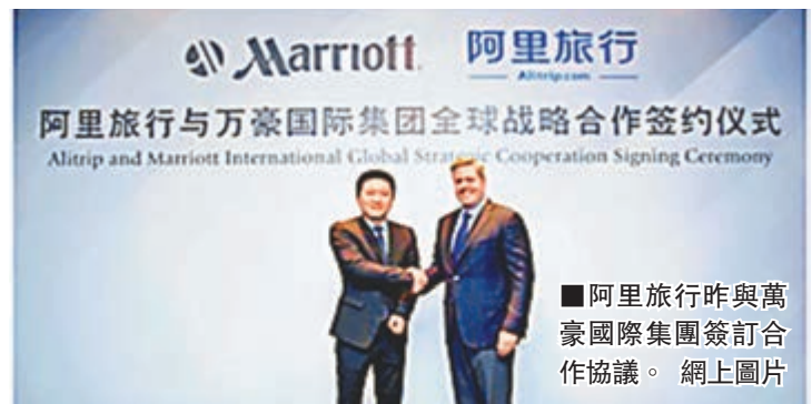
■阿里旅行昨與萬豪國際集團簽訂合作協議。