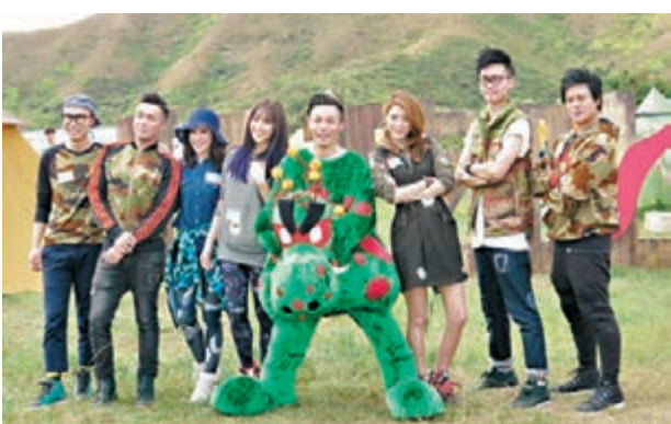
周柏豪的「垃圾蟲」造型最受歡迎，大家都爭着與他合照。

香港文匯報訊(記者李慶全)《2015年度叱咤樂壇流行榜頒獎典禮》將於明年1月1日舉行，昨日於上水馬草壟舉行記者會，出席有謝安琪(Kay)、薛凱琪(Fiona)、張敬軒、周柏豪、麥浚龍、鄭融、鄭欣宜、關心妍、許廷鏗、樂隊C AllStar及RubberBand等近百歌手，各歌手雖山長水遠去郊遊，但仍悉心打扮，其中周柏豪的「垃圾蟲」造型最受歡迎，大家都爭着與他合照。