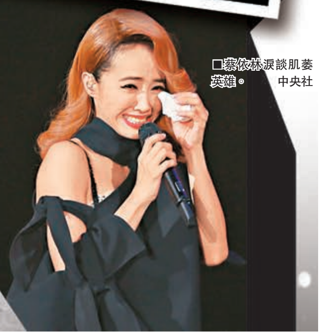
蔡依林淚談肌萎英雄。中央社