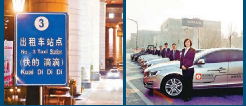
■「專車」逐漸融入民眾生活。圖為上海滴滴候車點。資料圖片