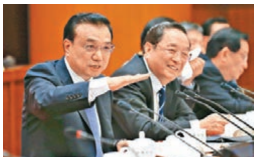
■中共中央政治局常委、國務院總理李克強(左一)應邀出席並作報告。中共中央政治局常委、全國政協主席俞正聲(左二)主持開幕會。

香港文匯報訊 政協第十二屆全國委員會常務委員會第十三次會議近日在京閉幕。會議期間，中共中央政治局常委、國務院總理李克強應邀出席閉幕會並作報告。中國政府網發佈消息披露，李克強主動要求回答政協委員的提問，涉及民企「走出去」、全面二孩、精準扶貧等問題。