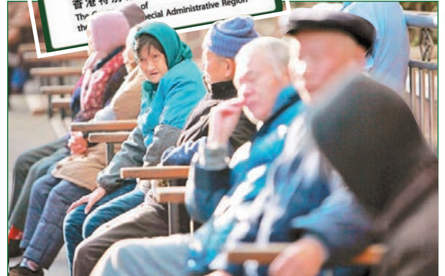
■內地老齡化日趨嚴重，國內生產總值的增長跟不上老齡化的速度。圖為內地安老院的老人們在休憩。