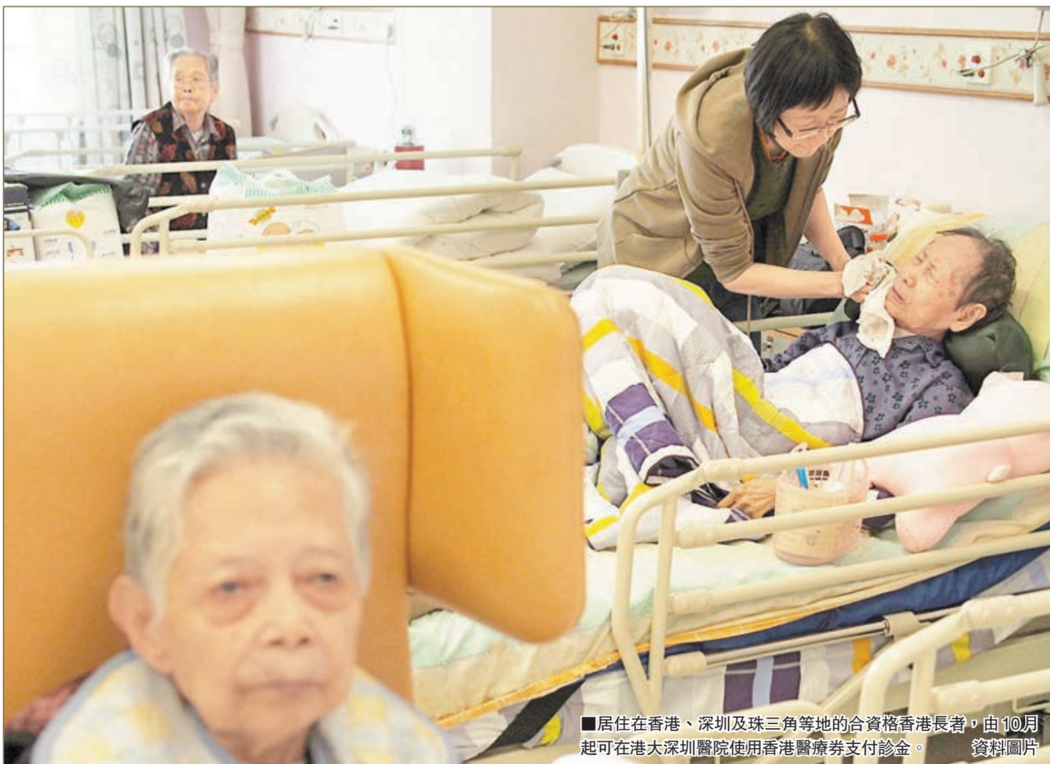
■居住在香港、深圳及珠三角等地的合資格香港長者，由10月起可在港大深圳醫院使用香港醫療券支付診金。資料圖片

近年，中國人口老齡化也越來越嚴重。內地的人口老齡化現象呈現以下3個特點：增速驚人、東快西慢、未富先老。人口老齡化對內地的社會資源和醫療制度帶來不少考驗。