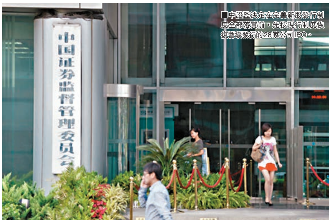
中證監決定在完善新股發行制度全部落實前，先按現行制度恢復暫緩發行的28家公司IPO。

日於網站通報了對6宗涉新三板違法違規案件履行行政處罰事先告知程序、集中對8宗案件作出行政處罰決定以及對7家證券、基金經營機構採取行政監管措施的具體情況。