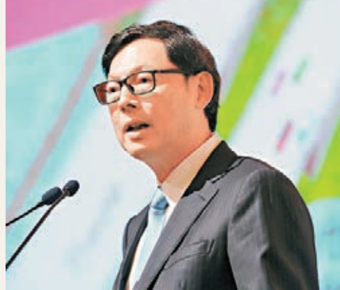
陳德霖稱，內地安排好退出機制及推進金改，可助恢復投資者信心。

香港文匯報訊(記者海巖 北京報道) 針對內地6月以來的政府救市，香港金管局總裁陳德霖昨日在北京出席財新峰會時指出，近期內地採取了一系列非常手段防範系統性風險，只要市場穩定，中央政府盡早安排好退出機制，並繼續推進金融改革，包括資本賬開放和人民幣國際化，以實際行動證明中國改革開放的堅定決心，就能恢復國內外投資者對中國市場的信心。