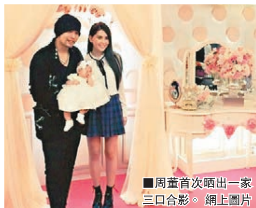
■周董首次晒出一家三口合影。