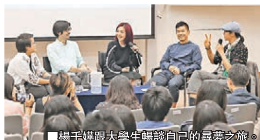
■楊千嬅跟大學生暢談自己的尋夢之旅。