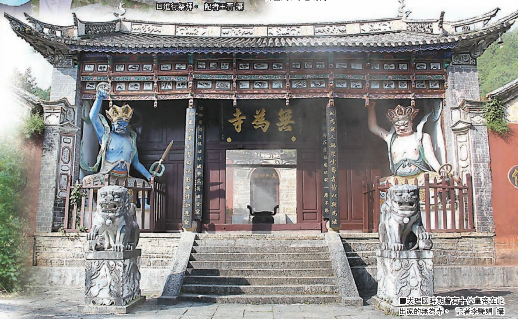
大理國時期曾有十位皇帝在此出家的無為寺。