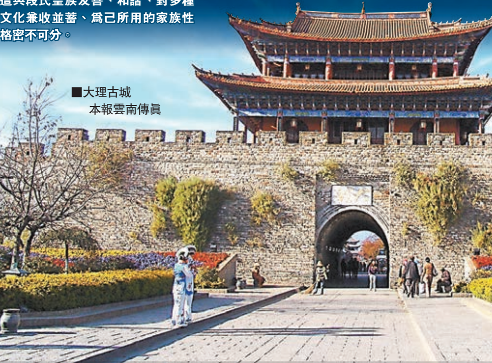
大理古城 本報雲南傳真

皇陵的概念，死後便是火葬，骨灰根據身份地位不同分別放入金、銀、銅、瓷、陶等不同類型的罐中，這和中原皇室死後大修陵寢極為不同。同時，大理國君王崇尚佛教，講求節儉和喜捨之心，認為節儉利於自己的修行，更不會奢靡大修陵寢。所以，所謂大理國的皇陵並不存在。