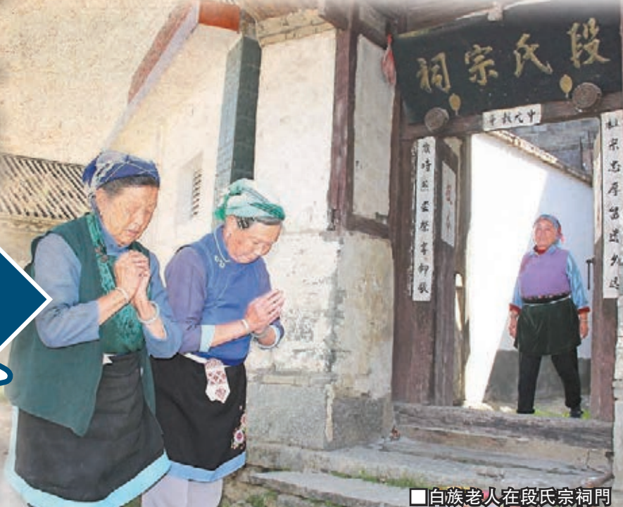
白族老人在段氏宗祠門口進行祭拜。

無為寺至今仍保留着練武習俗。據《靈鷲勝景 帝王遺蹟》一書介紹，從1995年開始，來寺學習無為功夫的人絡繹不絕，至今已超過80個國家的外國人來學習功夫。