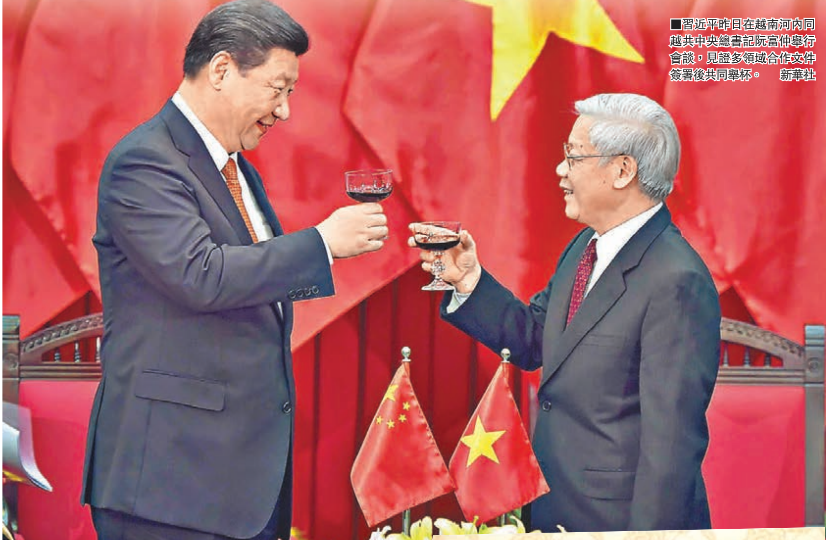
■習近平昨日在越南河內同越共中央總書記阮富仲舉行會談，見證多領域合作文件簽署後共同舉杯。

習強調，中越山水相連、唇齒相依，中越是具有戰略意義的命運共同體。兩國在爭取國家獨立和民族解放鬥爭中並肩戰鬥，在社會主義革命和建設事業中相互幫助，由毛澤東主席、胡志明主席等雙方老一輩領導人親手締造的「同志加兄弟」傳統友誼歷久彌堅，是中越雙方必須維護好、傳承好的共同財富。習近平對越南共產黨成立85周年、越南建國70周年表示誠摯的祝賀。