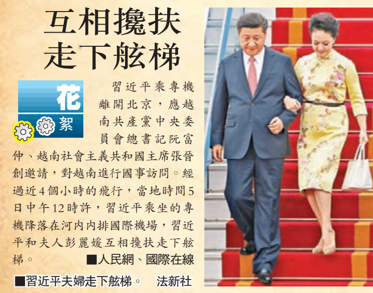
■習近平夫婦走下舷梯。