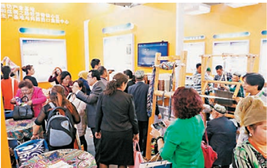
■新疆首次組團參加了本次紡博會。圖為新疆館內人潮湧動。