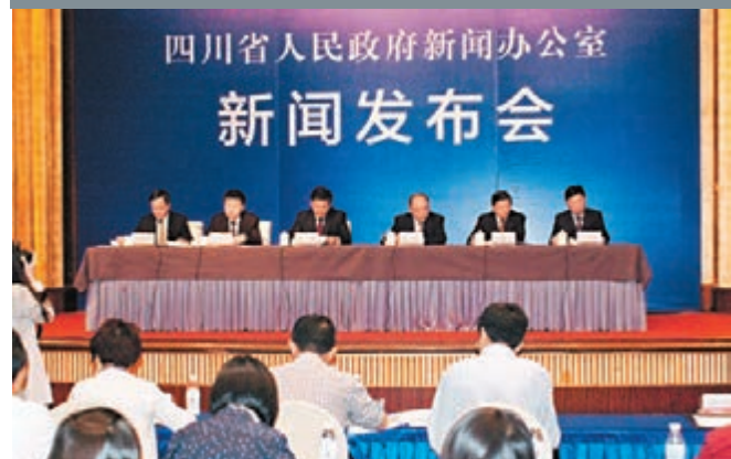
■西部製博會暨歐亞工博會舉行,圖為新聞發佈會現場。

香港文匯報訊(記者 李兵 德陽報導)記者從四川德陽有關方面獲悉,第21屆中國西部(德陽)國際裝備製造業博覽會暨中國歐亞國際工業博覽會日前在德陽廣漢市舉行。