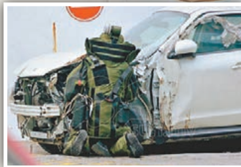
拆彈專家嘗試拆除車輛內的爆炸裝置。