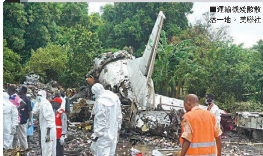
運輸機殘骸散落一地。美聯社

亞美尼亞駐埃及大使館證實，空難死者包括5名亞美尼亞機組人員。失事的俄製安東諾夫-12螺旋槳飛機起飛後不久，便墜落距機場跑道僅800米處，機身跌落樹林，殘骸散佈河岸。目擊者指，運輸機原本墜落市集，幸機師及時改變方向。南蘇丹總統發言人指，運輸機原定前往北部上尼羅州的帕洛伊奇油田。 ■法新社/路透社/美聯社