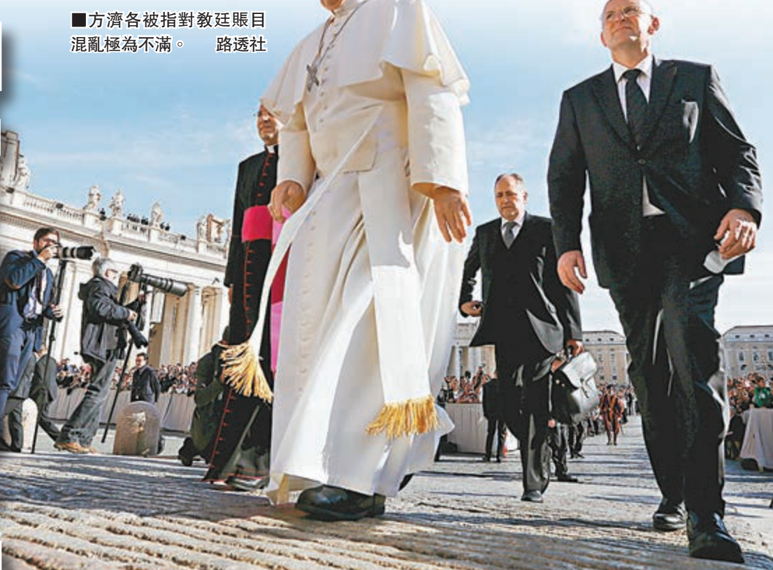
方濟各被指對教廷賬目混亂極為不滿。

梵蒂岡近年接連傳出醜聞，教宗方濟各近年大力提倡改革，教廷內部賬目卻管理不善、欠缺透明，甚至出現「財政黑洞」。意大利記者努齊在今日出版的新書《聖殿的商人》(Merchants in the Temple, 暫譯)中，揭露教廷財政混亂，富人更可藉捐款左右封聖名單，封聖的「價位」最高可達75萬歐元(約635萬港元)。