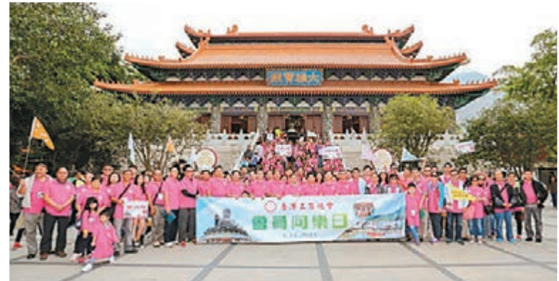
■香港工商總會同仁在寶蓮禪寺大雄寶殿前合影