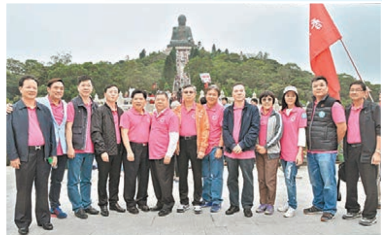
■總會首長於大佛前合影