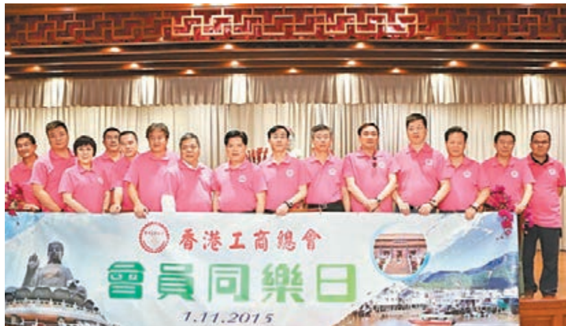
■總會會長、正副主席與會員同唱齋宴