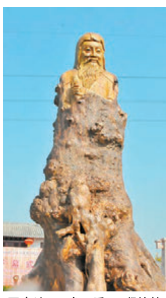
■高達6.5米、重16噸的許慎金絲楠木雕像。

此次研討會集結了國內文字學領域有成就的專家學者，他們將就「許慎與中華傳統文化」等話題進行討論，推動許慎研究成果在當代的發展。