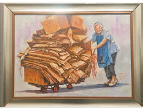
■《香港精神—自力更生》