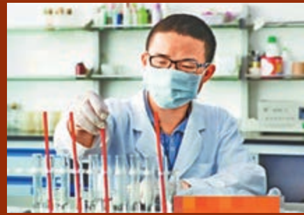
■范工正在對樣本檢測。

廣東人餐前沖洗餐具「省級潔癖」深入人心。但茶水沖燙真的有殺菌消毒效果嗎？記者近日隨機從廣州某餐館抽取經過消毒的塑料筷子，送往某實驗室檢測。試驗結果顯示：該批次筷子，無論沖洗與否，微生物指標細菌數量很少，甚至沒有。但將同批次筷子置於潮濕環境暴露三天，再經不同水溫沖洗，結果顯示樣品殘留細菌超標。工程師表示，用水沖洗筷子的確可以沖掉部分細菌，但不能完全殺菌，水溫的影響也沒有定論。