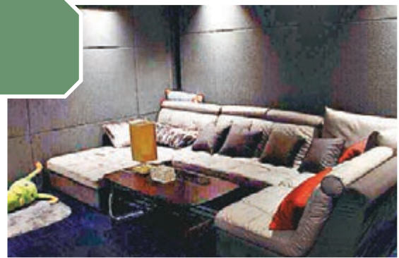
■位於福州萬寶商圍內的一家私人電影院的內部擺設。