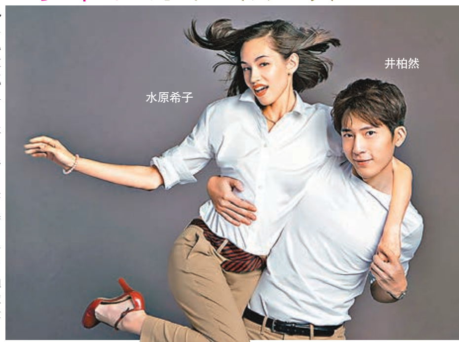
日本女模水原希子與井柏然一起拍廣告，穿上casual的白恤衫和卡奇褲「情侶裝」，攬腰摸面，相當sweet。

香港文匯報訊為慶祝美國悠閒服品牌GAP進駐內地5周年，品牌特別邀請了3對亞洲的人氣男女明星，包括水原希子與井柏然、張震與白百合和林俊傑與R(α)成員Krystal鄭秀晶，聯手拍攝了新一輯廣告，而廣告就由著名攝影師夏永康操刀拍攝。