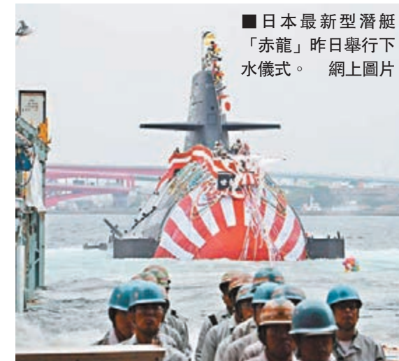
■日本最新型潛艇「赤龍」昨日舉行下水儀式。

日本海上自衛隊最新型潛艇昨日在神戶市的川崎重工神戶廠舉行下水儀式，並以守護南方的神龍「赤龍」命名。「赤龍」下水後會用1年多時間安裝設備，預定2017年3月交付予防衛省，部署地點暫時未定，但據報會用於釣魚島所在的西南諸島海域的防務。