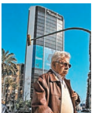
■西班牙薩瓦德爾銀行決定減少抹窗次數，節省開支。網上圖片