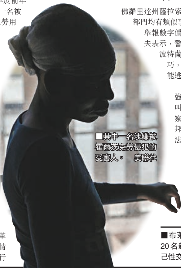
■其中一名涉嫌被霍爾茨克勞侵犯的受害人。