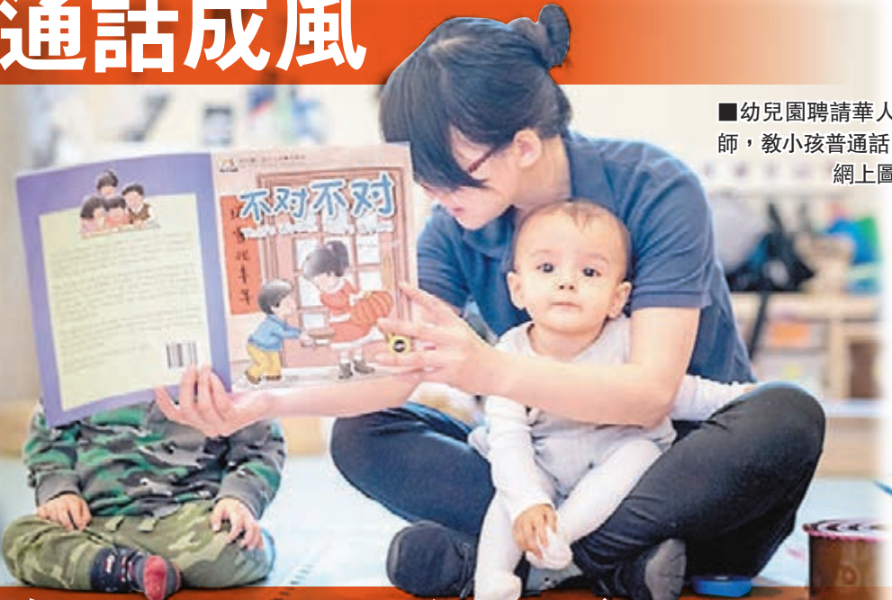
幼兒園聘請華人教師，教小孩普通話。網上圖片