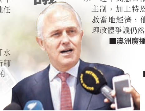
特恩布爾指爵位銜頭已不合時宜。