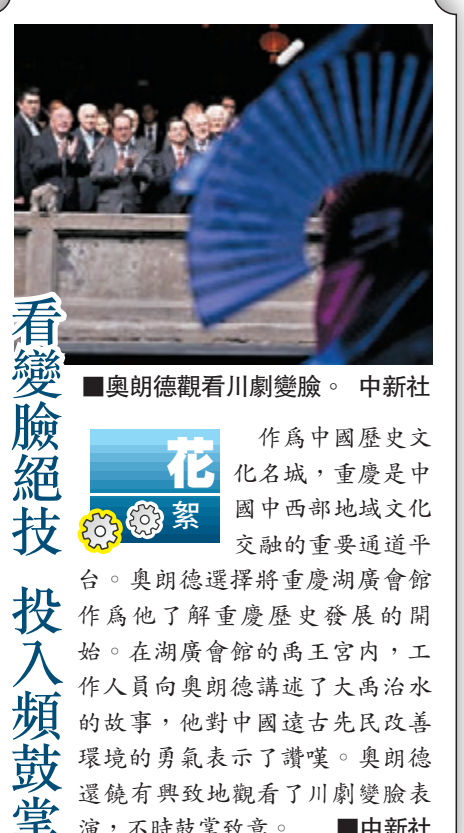
看變臉絕技 投入頻鼓掌

此外，雙方望借此次會面，洽談將國際賽車盛事——勒芒24小時耐力賽中國站引進武漢。代表團隨後參觀賽車場選址地等地。