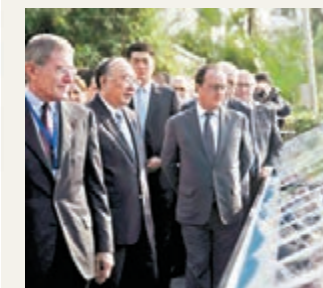
奧朗德細心了解污水廠情況。

香港文匯報訊 奧朗德昨日上午乘坐專機抵達重慶，拉開他擔任法國總統以來第二次訪華之旅的序幕。據中新社報道，此次是奧朗德首次正式訪問重慶，並有官方代表團和文化界人士、企業家隨行。在渝期間，奧朗德在重慶市長黃奇帆的陪同下，先後參觀了重慶中法唐家沱污水處理廠和湖廣會館，了解重慶經濟社會和文化發展情況。