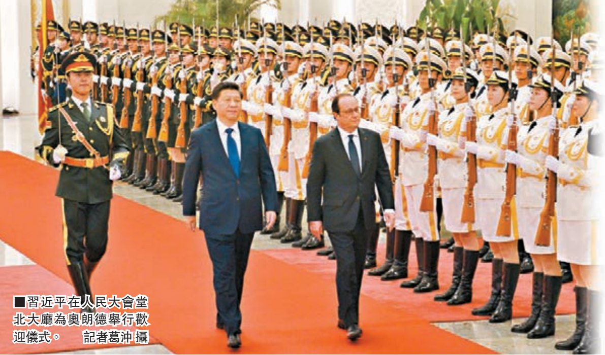
習近平在人民大會堂北大廳為奧朗德舉行歡迎儀式。