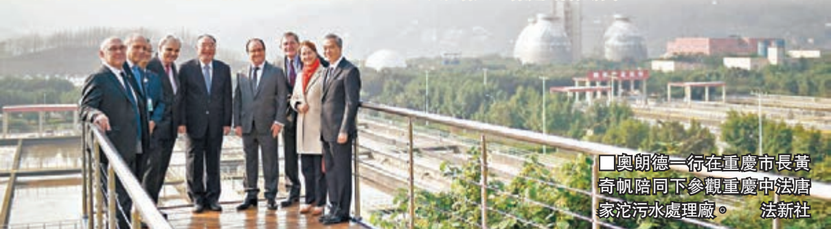
奧朗德一行在重慶市長黃奇帆陪同下參觀重慶中法唐家沱污水處理廠。

另據《歐洲時報》報道，陪同奧朗德訪華的有外交部國際發展部長洛朗·法比尤斯，生態、可持續發展和能源部長塞戈萊納·羅亞爾，財政與公共賬目部長米歇爾·薩班，政府與議會關係事務國務秘書讓·瑪麗·勒甘，社會事務、衛生和婦女權利部負責家庭、兒童、老年人和自主事務國務秘書洛朗絲·羅西涅爾。另外也有眾多企業家、創業者、文化界人士和公民社會人士會隨奧朗德訪華。