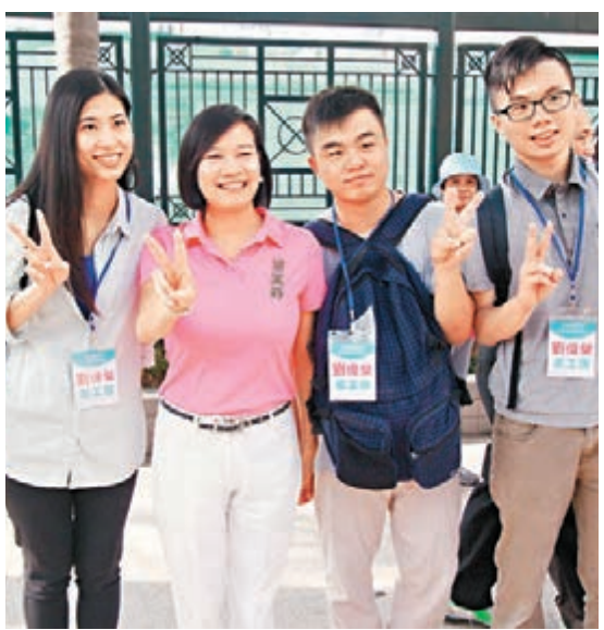
梁美芬(左二)提出「理性議政、實幹為民」。資料圖片

香港文匯報訊（記者 鄭治祖）今屆共派出16人出選區議會選舉的經民聯，日前舉行誓師儀式，浩蕩參選。其中，多位經民聯候選人的政綱均強調專注民生工作，針對地區需要積極爭取改善各項措施，政綱涵蓋房屋、法律、環保、衛生等方面，貫徹經民聯以專業服務社區的務實作風。競選連任九龍城黃埔東選區區議員的立法會議員梁美芬，更在政綱強調為香港未來堅決反對「佔中」、拉布和撕裂香港的行徑。