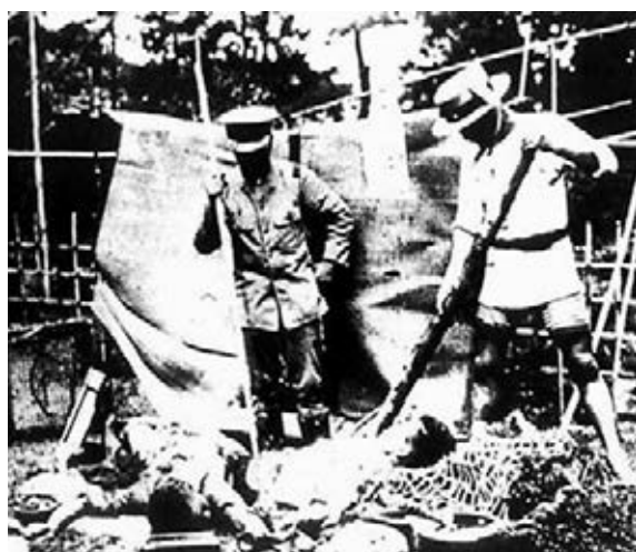
發生在日本關東的「大屠殺」情景。