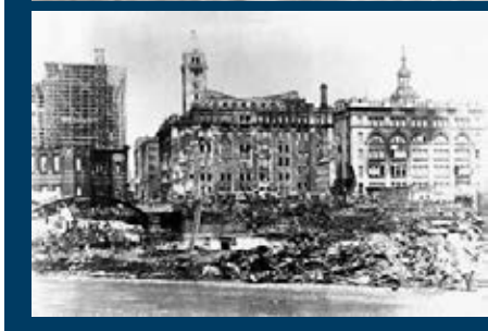
1923年的日本「關東大地震」引發了之後的「關東大屠殺」。 資料圖片