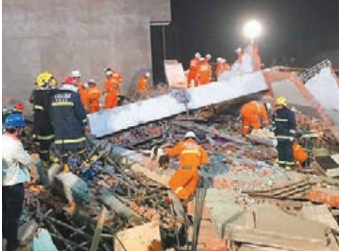
■事發後，救援隊徹夜施救。 本報河南傳真

香港文匯報訊（綜合記者 曹宇及中新社河南報道）位於河南省舞陽縣北舞渡鎮轄區內的一民房前日下午在改造時突然發生坍塌，數十名工人被埋。根據舞陽縣官方最新通報，截止到目前，現場的救援工作已經結束。該事故共救出施工人數40人，其中17人遇難，9人重傷，14人輕傷。而住建部也於昨日要求各地加強安全管理。