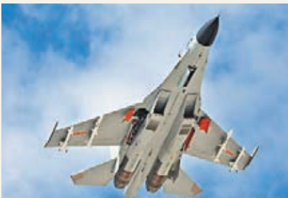
殲11B戰機掛導彈飛赴南海。 資料圖片

與殲-10中型戰機相比，殲-11B戰機航程更遠，載彈量更大；與蘇-27相比，殲-11B在隱身、火控、電子系統、雷達、機體壽命等方面都有大幅改進和創新。