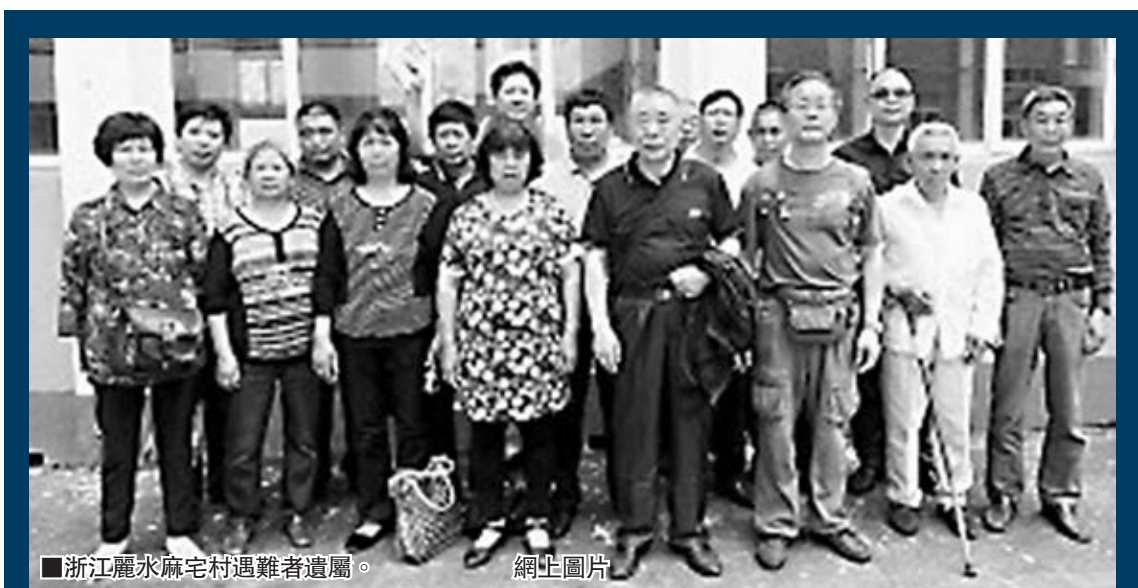
浙江麗水麻宅村遇難者遺屬。 網上圖片

「我們已經為在大屠殺中被殺害的500名浙江青田中國勞工的後裔討回了公道，福清的受害者後裔我們也一定要找到！」林伯耀表示。