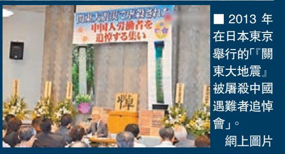
2013年在日本東京舉行的「關東大地震」被屠殺中國遇難者追悼會。 網上圖片