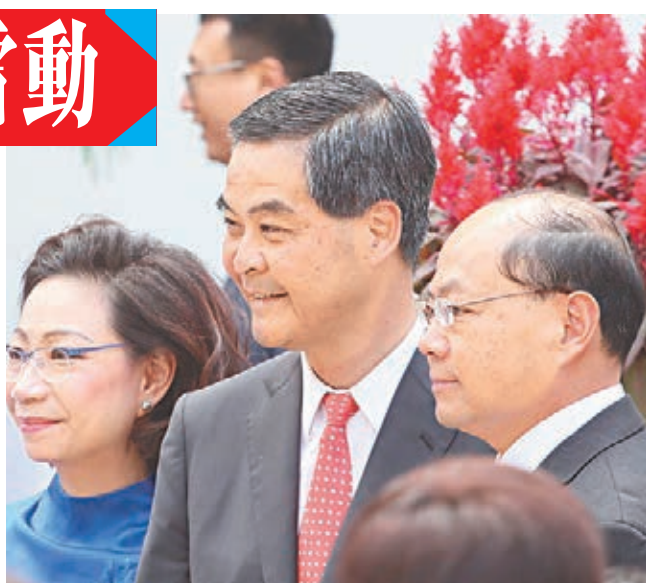
曾偉雄獲頒授金紫荊星章,與梁振英伉儷合照。

由於是次頒授典禮屬閉門進行,傳媒未能觀看裡面情況。出席是次典禮並獲頒銅紫荊星章的民建聯屯門區議員陳雲生昨日向本報透露,曾偉雄上台接受勳銜時,全場反應熱烈,掌聲雷動,歷久不散,反映在場嘉賓都十分認同曾偉雄過往的工作,獲授勳銜絕對實至名歸。