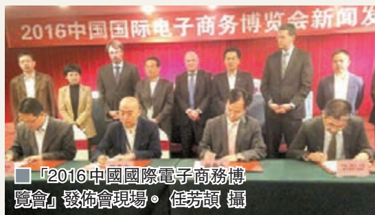
「2016中國國際電子商務博覽會」發佈會現場。

香港文匯報訊(實習記者 任芳韻 北京報道)以「電商換市 全球機遇」為主題的「2016中國國際電子商務博覽會」將於明年4月11日至13日在浙江義烏舉辦,博覽會預設國際標準展位2,000個以上,展覽面積超5萬平方米。屆時,跨境電商展區、移動互聯網展區、互聯網金融展區等新設展區將首度亮相。為順應社會進步需求,博覽會除知名電子商務平台展區、電子商務示範城市/示範基地/示範企業展區、電子商務服務產業展區、電子商務人才服務展區、精品網貨展區等特設展區外,將新增設跨境電商展區、移動互聯網展區、互聯網金融展區等展區。