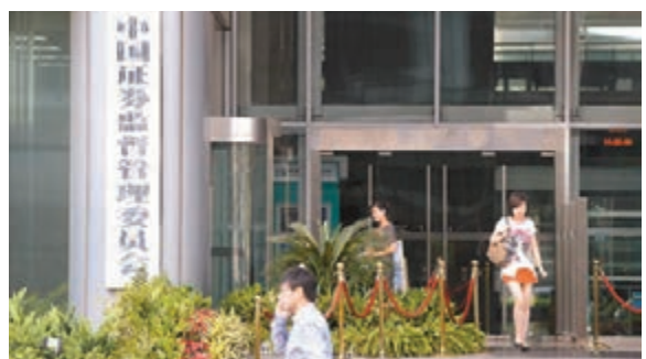
■中證監審理認定8宗證券違法案件,擬罰沒金額總計近1.47億元人民幣。資料圖片

香港文匯報訊(記者 海巖 北京報道)內地監管部門持續打擊證券違法。中證監新聞發言人鄧舸30日在例行發佈會上表示,日前中證監審理認定8宗證券違法案件,涉及內幕交易、違法訊息披露、未勤勉盡責等違法行為,擬罰沒金額總計近1.47億元(人民幣,下同),擬對8名當事人採取證券市場禁入措施,其中3名當事人終身禁入市場。同時,10宗上市公司大股東