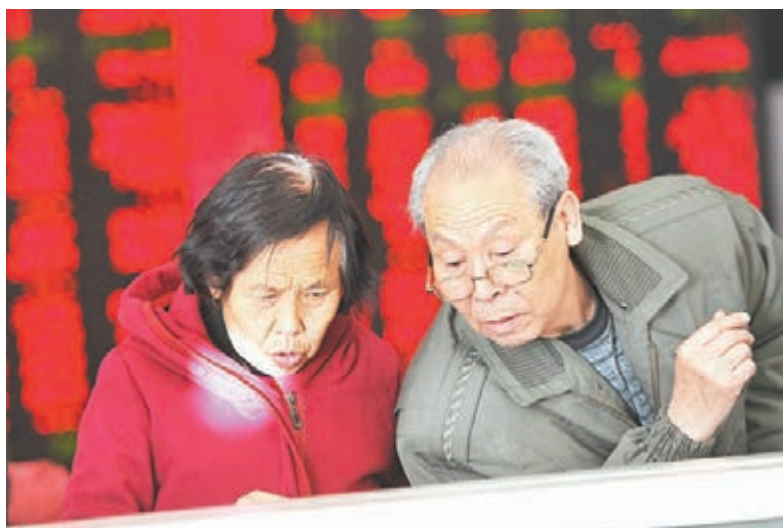
■股民在翻紅的股指大盤前討論漲停個股。