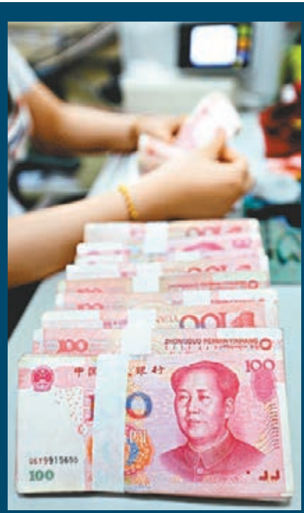
金管局的數據顯示,9月底人民幣存款按月減少8.5%,至8,954億元人民幣,為歷來最大單月跌幅。