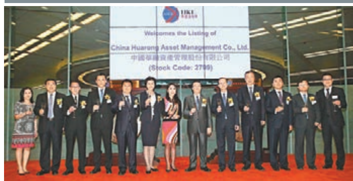
中國華融資產管理股份有限公司上市儀式。