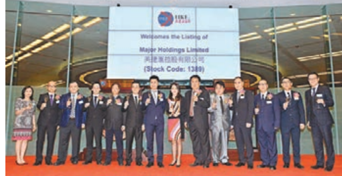
美捷匯控股上市儀式。

香港文匯報訊(記者 曾敏儀)港股連跌3日,暗盤跌破招股價的中國華融(2799)昨日掛牌,開市報3.12元,較招股價3.09元高近1%,最高見3.15元,收市回落至3.1元,險守招股價,每手賬面微賺10元,全日成交逾9.5億元。