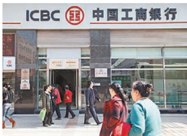
工商銀行昨公佈第三季業績,純利727.4億元人民幣,按季增長0.52%。資料圖片

而截至9月底,核心一級資本充足率12.41%,一級資本充足率12.67%,資本充足率14.43%。