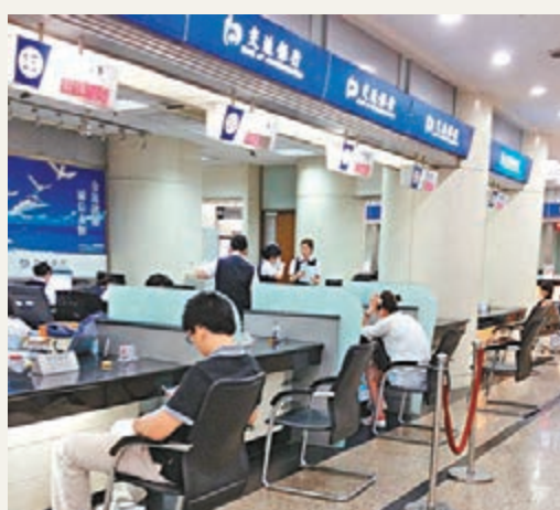
圖為客戶在交通銀行內等待購買理財產品。資料圖片

香港文匯報訊(記者 吳婉玲)交通銀行(328)昨亦公佈截至九月底止的第三季業績,純利按年跌0.22%至147.16億元(人民幣,下同);首三季純利按年升1.01%至520.4億元。該行表示,不良貸款增長有逐季放緩的趨勢,9月底的減值貸款餘額為528.75億元;減值貸款率為1.42%。