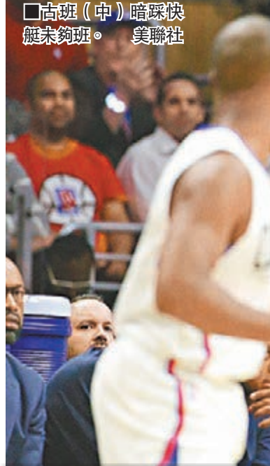
■古班(中)暗踩快艇不夠班。