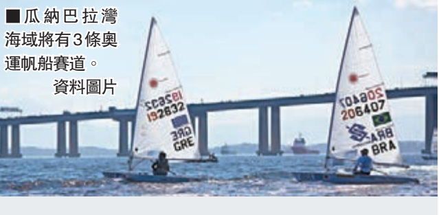
■瓜納巴拉灣海域將有3條奧運帆船賽道。資料圖片

已由2009年的12%至13%,升至如今的50%,到奧運會開幕前,將有80%的垃圾得到清理,里約會兌現申辦時許下的諾言。此外,里約在每個月都監測水質,採取的清理措施可以保證比賽海域水質符合國際標準。今年進行的奧運帆船測試賽中,有選手參賽後生病,雖然沒有確診是否因病毒感染所致,但外界普遍對里約的水質表示擔憂。