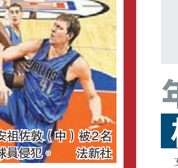
■迪安祖佐敦(中)被2名小牛球員侵犯。