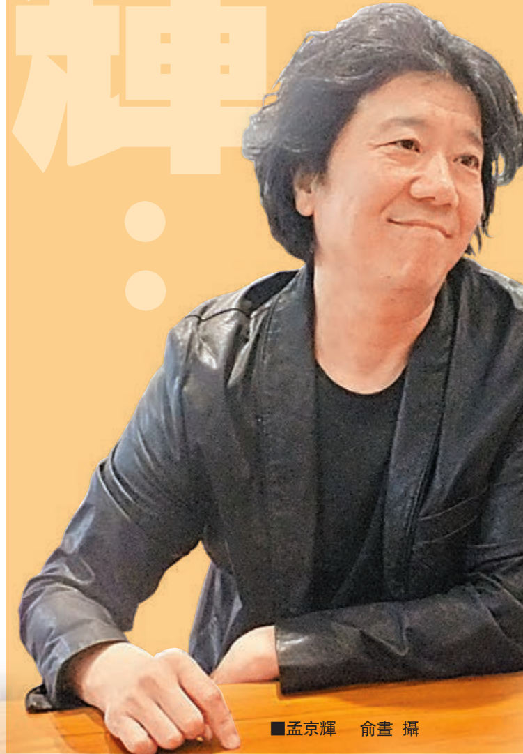
孟京輝

為第三屆烏鎮戲劇節的藝術總監，孟京輝為記者安排了咖啡啤酒暢飲的專訪時間，他拉開凳子隨意一坐，說：「我準備好了，你們可以開始審我了。」典型的孟氏幽默引得全場一陣哄笑。