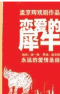
孟京輝作品《愛愛的犀牛》海報 本報浙江傳真