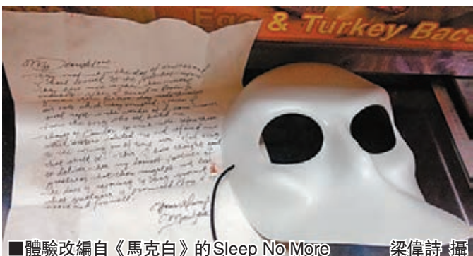
體驗改編自《馬克白》的Sleep No More