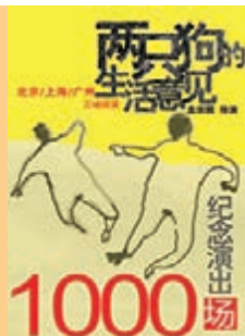
孟京輝作品《兩隻狗的生活意見》海報 本報浙江傳真