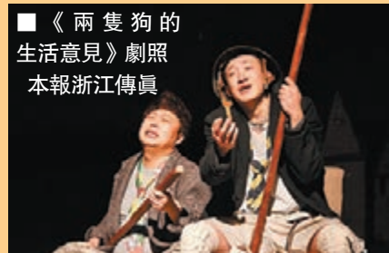
《兩隻狗的生活意見》劇照