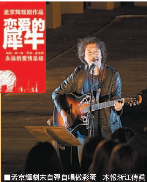
孟京輝劇末自彈自唱做彩蛋 本報浙江傳真