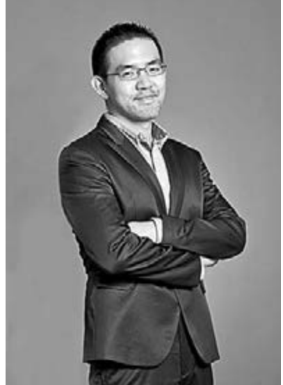
■焦元溥將於今晚在香港大學帶來一場「樂讀村上春樹」導覽。