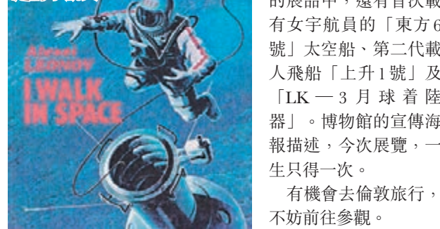
俄羅國今次運往倫敦的展品中，還有首次載有女宇航員的「東方6號」太空船、第二代載人飛船「上升1號」及「LK-3月球著陸器」。博物館的宣傳海報描述，今次展覽，一生只得一次。有機會去倫敦旅行，不妨前往參觀。