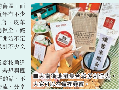
■大南街地攤集合眾多創作人，大家可以在這裡尋寶。

這次大南街地攤活動以野餐為主題，帶來多元類型的攤檔。不論是本地手創設計、懷舊復古、現場繪畫或是故事閒聊等，都一一呈現。活動靈活開放，有興趣擺攤的人士可自發準備地氈、輕食，一同加入。而喜歡逛市集的朋友，更不可錯過，除了認識新朋友、逛小店外，更可一睹深水埗區近年的轉變，這裡不只有貧窮、老舊，更集結很多有創意的年輕人，一起為實現開店理想而默默努力，並將創意帶入社區，激發活力。