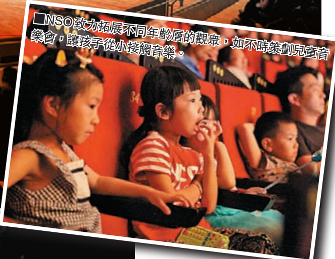
■NSO致力拓展不同年齡層的觀眾，如不時策劃兒童音樂會，讓孩子從小接觸音樂。

而明天在港演出的台灣愛樂NSO，亦非常擅長透過策劃各種節目來拓展觀眾，如以萬聖節為主題的音樂會、跨年音樂會，還有各式各樣的親子音樂會。每個年齡層的觀眾，總能找到適合自己的演出。 文：香港文匯報記者 伍麗微